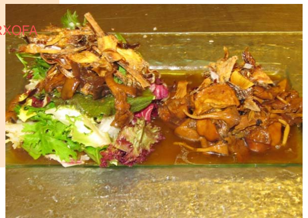
Recepta cedida pel Restaurant "El Terral"

100g de rossinyols 100g de trompetes 100g de camagroc 100g de llengua de bou Enciams variats, quantitat suficient 200 ml d'oli oliva verge 50 ml de vinagre de Mòdena Sal maldo 2 Carxofes Oli de gira-sol Maicena